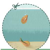
LA GRAINE TOMBE AU FOND