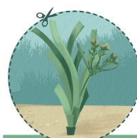
DÉVELOPPEMENT DES GRAINES

TU AS TERMINÉ TOUTES LES ACTIVITÉS ? BRAVO ! SI TU N'AS FAIT QU'UNE PARTIE, CE N'EST PAS GRAVE, TU POURRAS CONTINUER PLUS TARD.