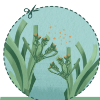
POLLINISATION & FÉCONDATION