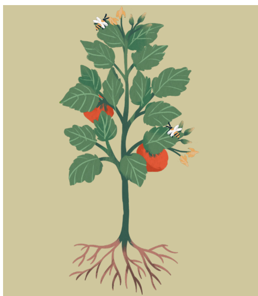
PLANTE À FLEUR TERRESTRE (PLANT DE TOMATE)

Regarde ces 2 dessins : entoure les ressemblances entre la posidonie et une plante à fleurs terrestre.