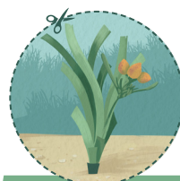
FLORAISON DE LA PLANTE