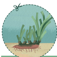
DÉVELOPPEMENT DE LA PLANTE